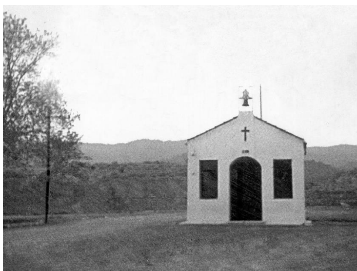
Pedestal original con la Cruz y primera capilla edificada en El Palmeral