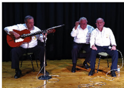
El Panadero, El Taxista y El Levantino