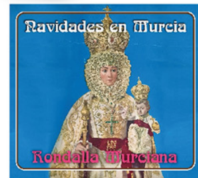
CD Navidades en Murcia