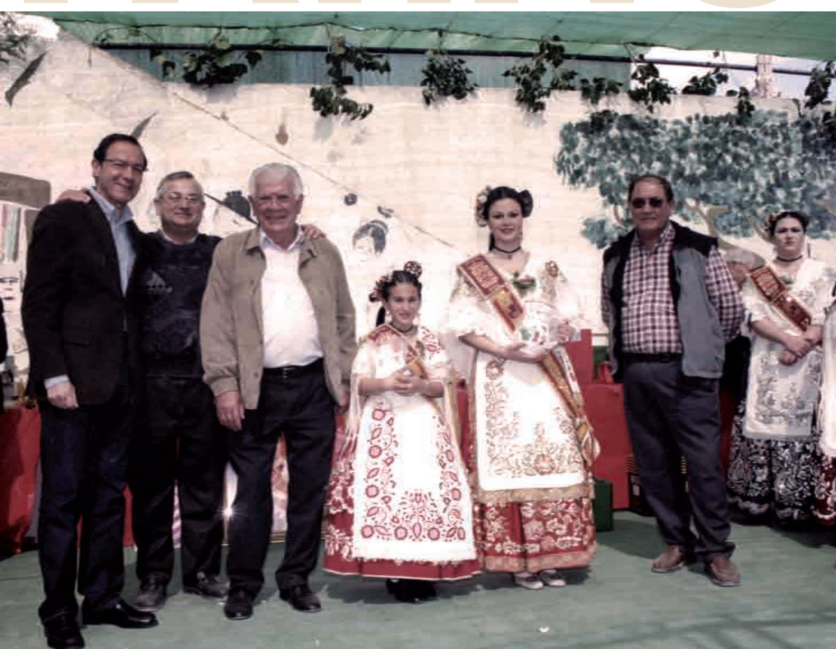
vv Cartagena 1985